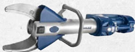
S 788 E2