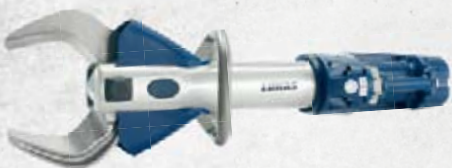
S 799 E2